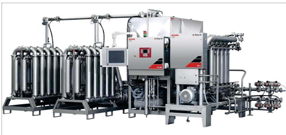
Flavy FX 200/ FX 3 LWL Tandem