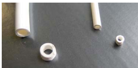
Membranas adaptadas para cada filtro tangencial

Flavy FX 200 – Flavy FX 3 LWL – PC Central - Cubeta de agua – Cubeta de retenidos