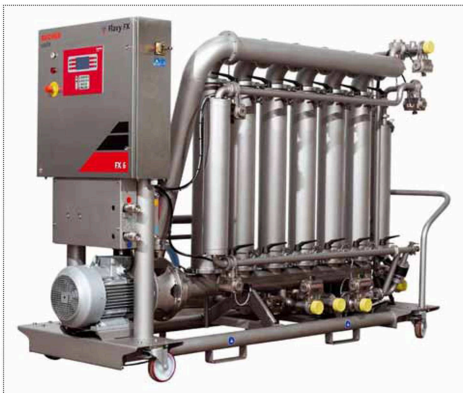
Flavy FX 6

La gama de filtros tangenciales Flavy FX 5 y FX 6 es la respuesta más adaptada a las exigencias de las bodegas cooperativas.