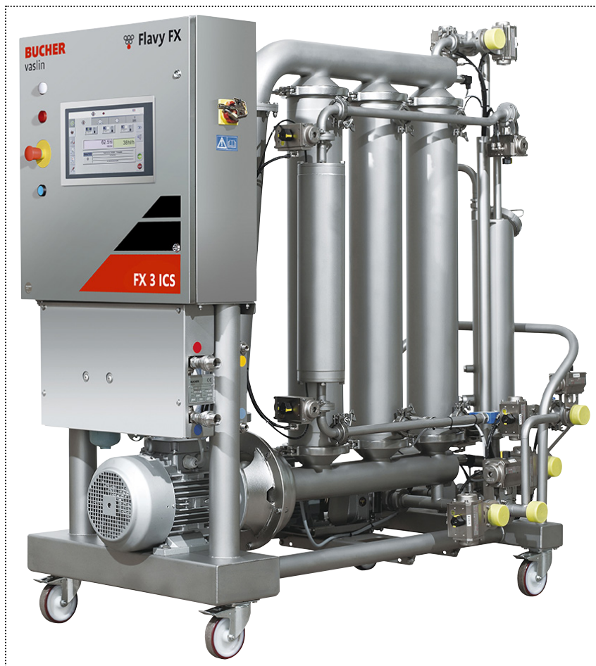
Flavy FX 3 LWL

Los filtros Flavy FX2 y FX3 LWL sólo tienen un objetivo: dar valor a las heces de filtración que provienen del filtro tangencial principal (utilizado anteriormente en la bodega).