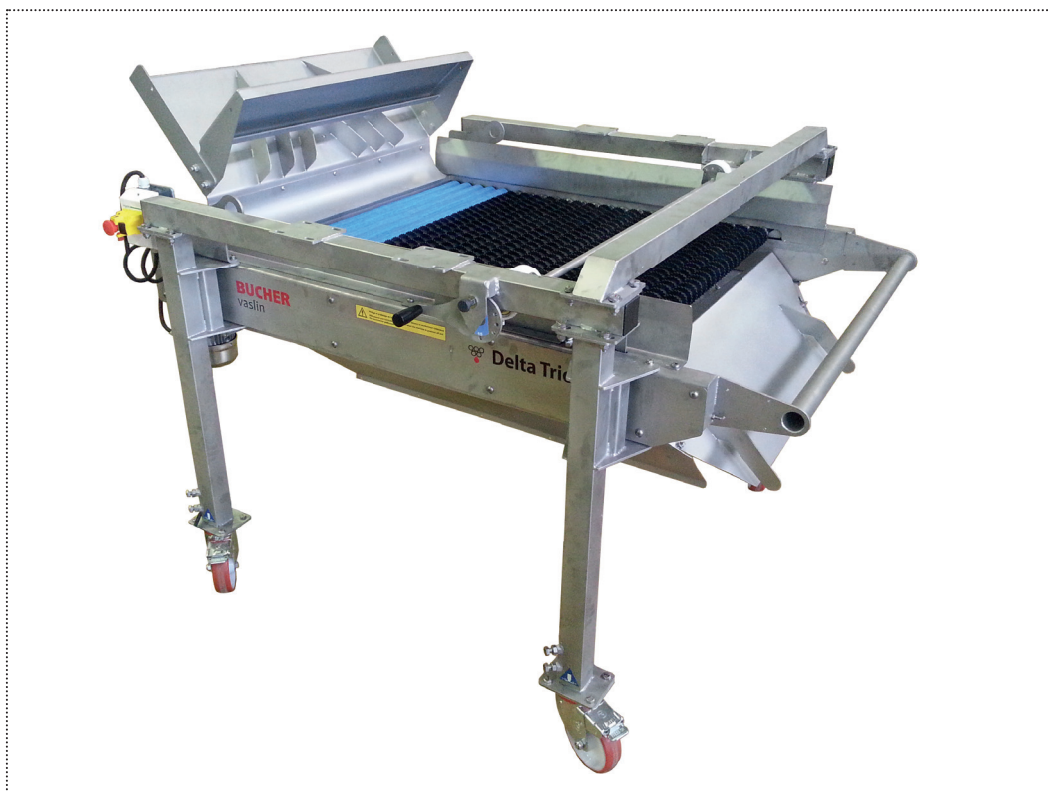
Delta Trio XM