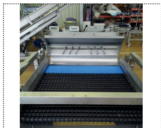
Tolva de alimentación y rodillos (Delta Trio XS / XM)