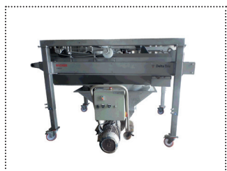
Delta Trio XL