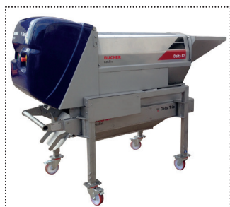
Delta Trio XS bajo de una despalilladora Delta E2