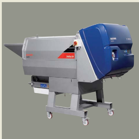
Delta E4 / F4

El mercado CE certifica la conformidad de los equipos con las directivas europeas. Bucher Vaslin S.A. es una empresa certificada ISO 9001 : 2000 por la AFAQ (Agence Française pour l'Assurance Qualité), agencia francesa de garantía de calidad.