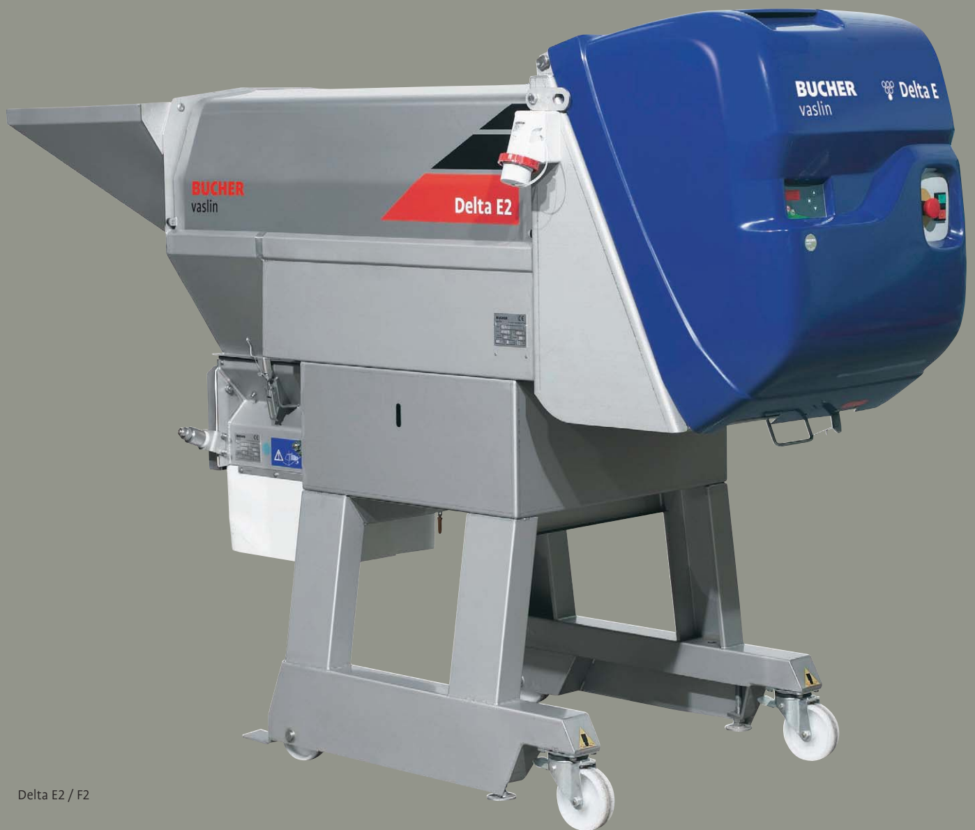
Delta E2 / F2