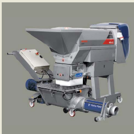
Delta E2 / F2 / PMV2