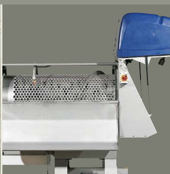
Despalladora abierta – Acceso fácil