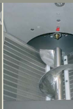
Tolva a husillo secadora