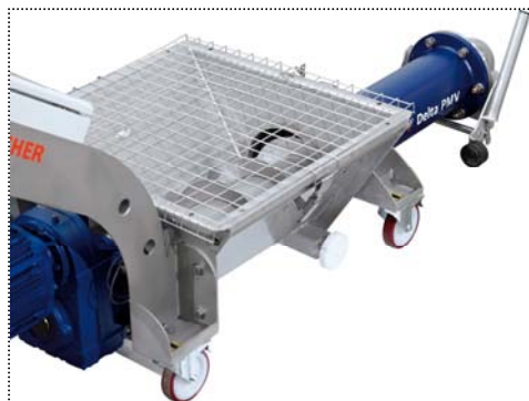
Tapón de desagüe