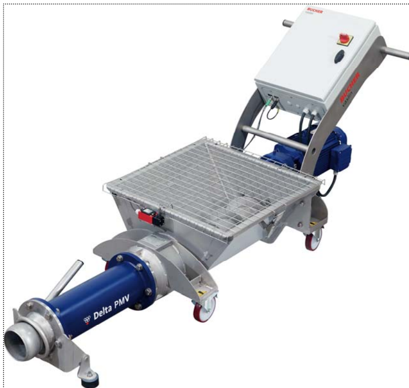
Delta PMV 2

En el centro de la cadena de vinificación, las bombas Delta PMV aseguran la recepción de las uvas frescas y están adaptadas al traslado de orujos fermentados (excepto Delta PMV1).